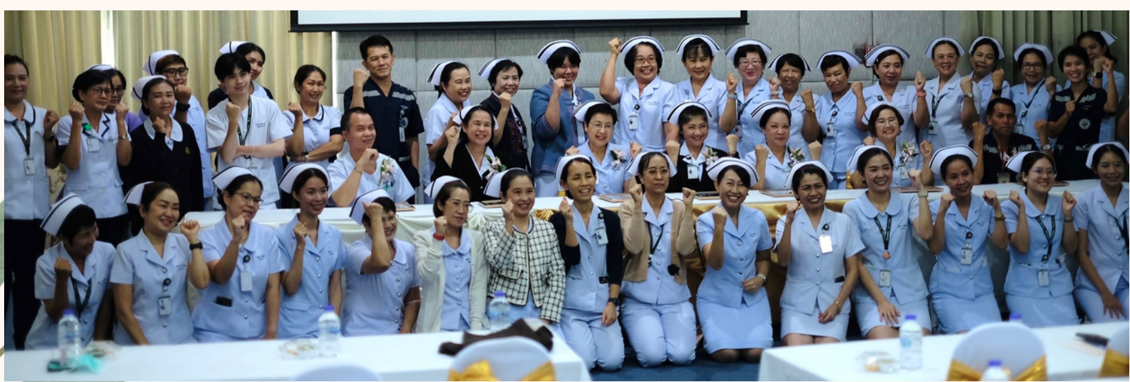
ภาพบรรยากาศงานตามรอยคุณด้าแข่งประสมการณ์ งานการพยาบาลผู้ป่วยนอกและผู้ช่วยฉุกเฉิน 7 สิงหาคม 2566 ณ ห้องประชุมเล็ก ชั้น15 อาคารเฉลิมพระบารมี